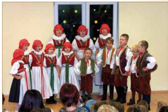
Výstoupení v Tovačově 2008 Velikonoce 2007 Vánoční vystoupení v MŠ 2006