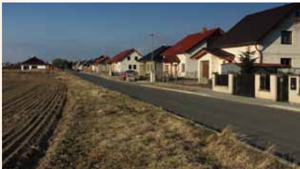
2009 Inženýrské sítě v ulici Polní