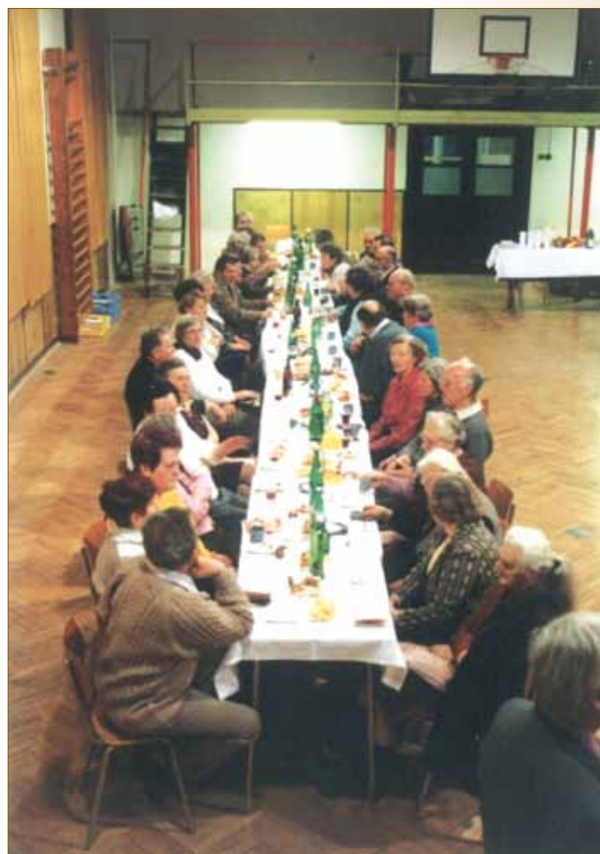
Vánoční setkání seniorů 2010 Jedno z prvních vánočních setkání seniorů