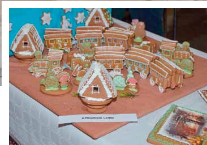
Vánoční výstava v sokolovně Výstoupení souboru Majetinek na vánoční výstavě 2011 Velikonoční výstava v ZŠ