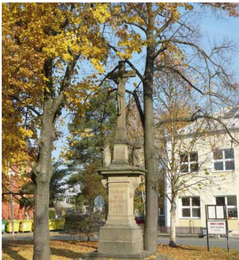
Kaplička v Olší Kamenný kříž u školy Cesta ke hřbitovu Farní kostel