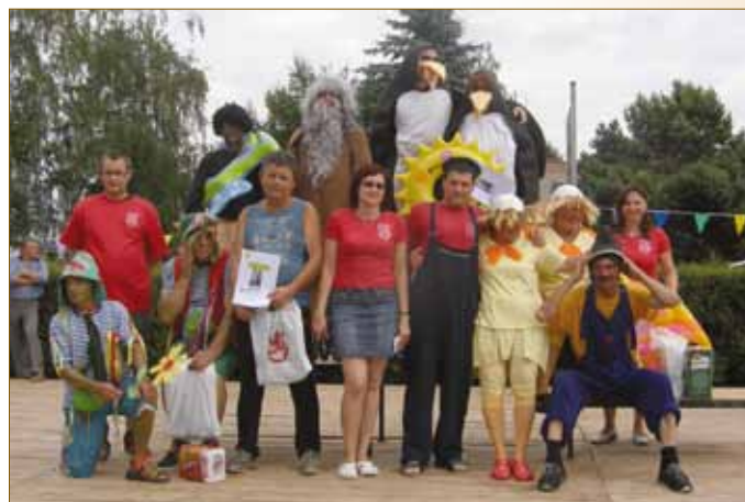
Vítězné plavidlo 2008 Neckiáda 2009 Vítězné neckiády 2010