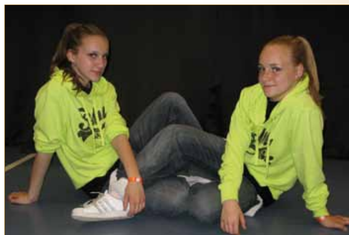
Malá skupina junioři - 1. vicemistři ČR v kat. hip hop 2011 Malá skupina dětí - 2. vicemistři ČR a 1. vicemistři světa v kat. street dance show 2007 L. Koutná, A. Snášelová 2010