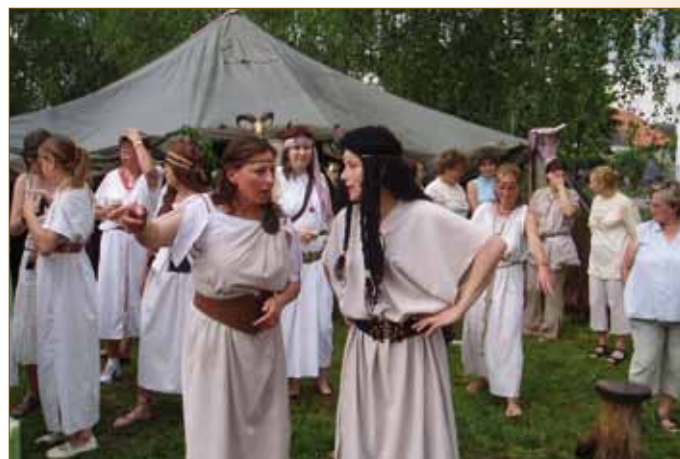
Scénka u májky 2007 Přívod obcí k sokolovně 2007 Příprava soutěží 2007