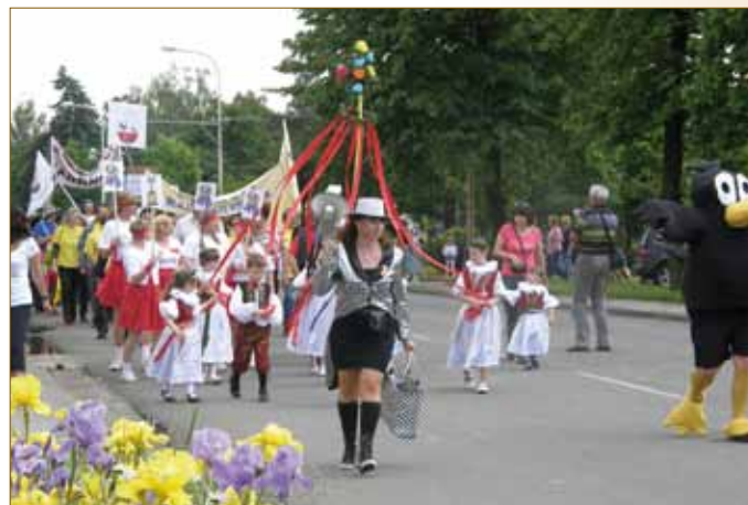
Soutěž Člověče, nezlob se na kácení máje 2009 Vystoupení oddílu jógy na kácení máje 2009 Průvod obcí do areálu za saunou 2010