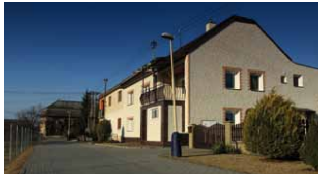
Panelák č. p. 13, ul. Školní