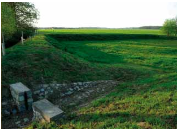
Pohled na obec od Kokor Zasakovací průleh k Olší Výsadba zeleně u Olší Suchý polder za Mlýnským potokem

Naše obec přispěla k doplnění protipovodňové ochrany území obce vybudováním suchého poldru, dalšími propustky a napojením příkopu za ulicí Kokorskou na výpusť z rybníka. Zajišťuje také trvalé doplňování a rozšiřování výsadb veřejné zeleně a její pravidelnou údržbu.