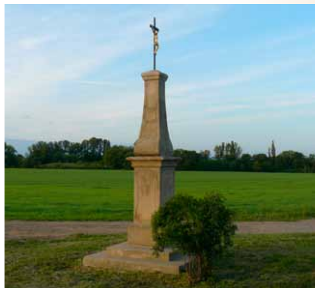
Oprava kříže u Kokor