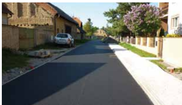
2011 Obnova ulice Za Humny – II. část