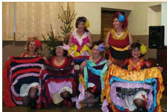
Vánoční setkání seniorů 2006 Vánoční setkání seniorů 2008 Vánoční setkání seniorů 2009, vystoupení Báječných ženských