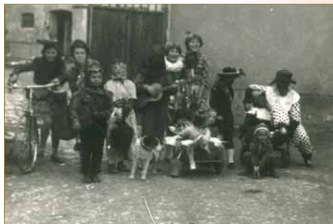
Kácení máje v ulici Novostavby 70. léta 20. st.