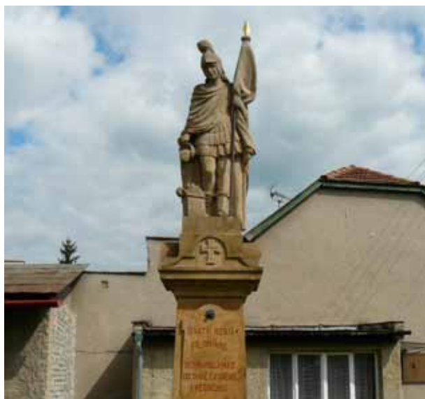
Oprava sochy sv. Floriána