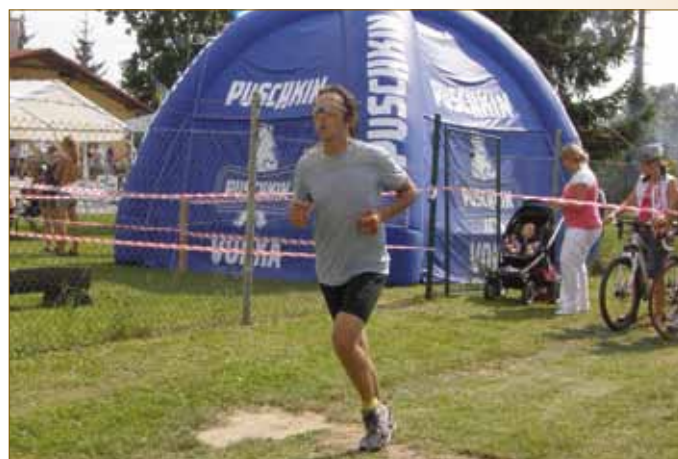
Majetnější triatlonisté 2009 Královský triatlon dospělí 2011 Královský triatlon dospělí 2009