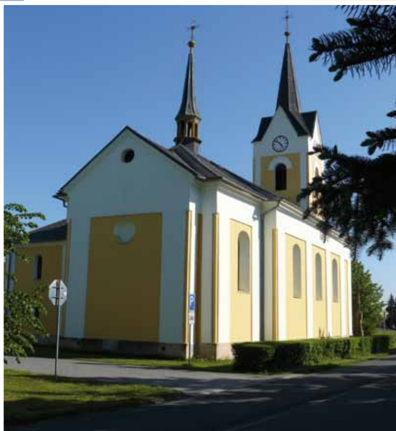
Kašna na návsi Boží muka u fotbalového hřiště Socha sv. Jana Nepomuckého Farní kostel