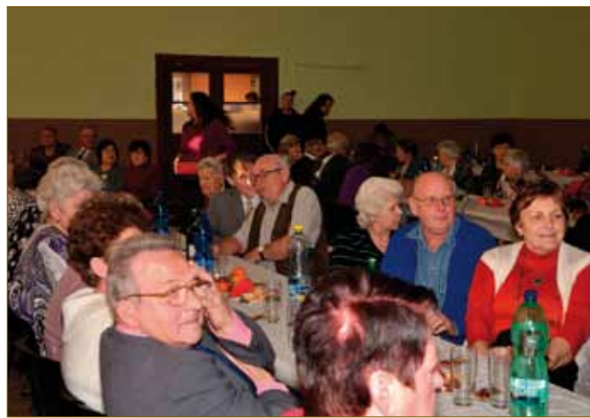
Výlet seniorů 2010 Vánoční setkání seniorů 2009 Vánoční setkání seniorů 2011