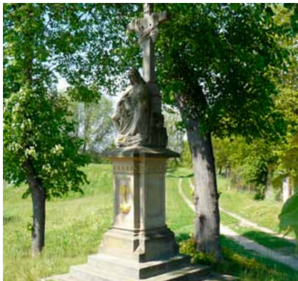
Oprava sousoší Piety