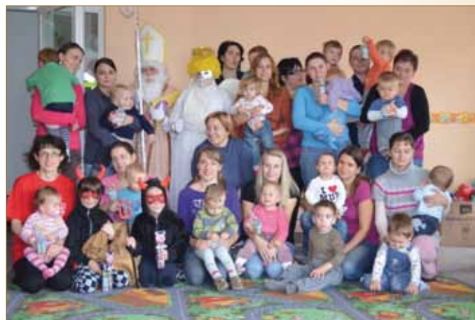
Otevření prostor RC v DPS 2011 Vánoční dopoledne 2011 Mikulášská besídka 2011