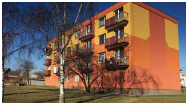
RD č. p. 5, dříve ul. Na Výsluní, nyní ul. Lipová