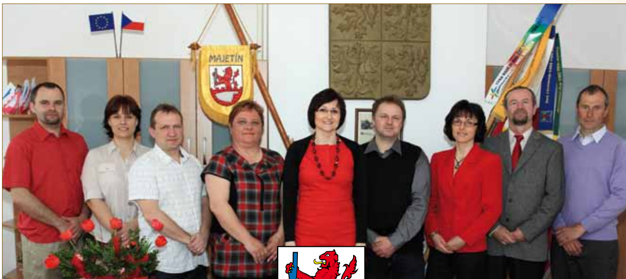
Zastupitelstvo obce Majetín 2010–2014