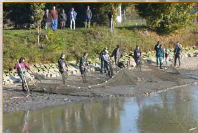
Výlov rybníka Hliník 2008–2009 Na druhé straně: Majetínská pískovna