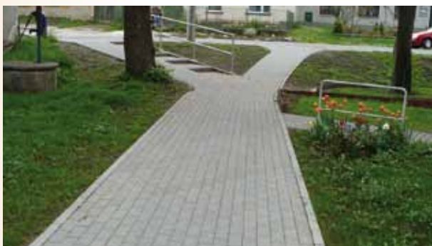
2010 Oprava sjezdu a chodníku v ulici Příčná