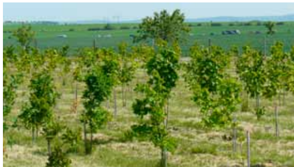
Výsadba zeleně u křížku u Kokor